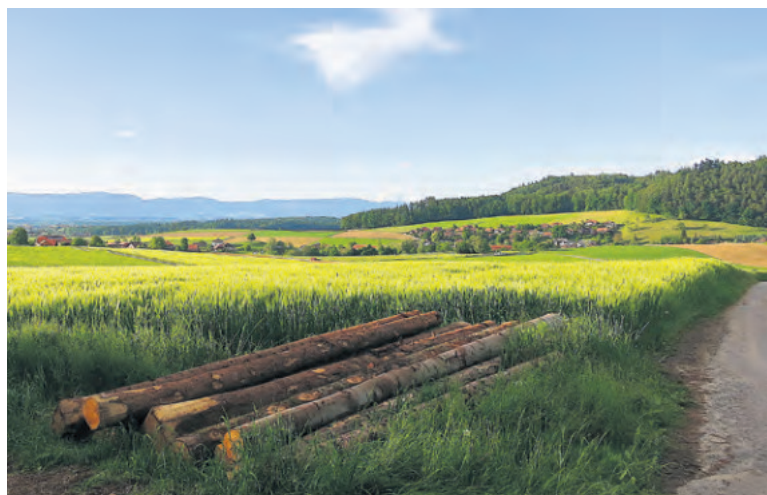
Bänkliwanderung: schöner Ausblick auf Hettiswil

Und wie intakt ist das Dorfleben in Hettiswil heute noch? Laut Dominic Lüthi verfügt das Dorf nur mehr über ein Restaurant, eine Schule und ganz wenig Gewerbe. Läden – ausser einer Gär-