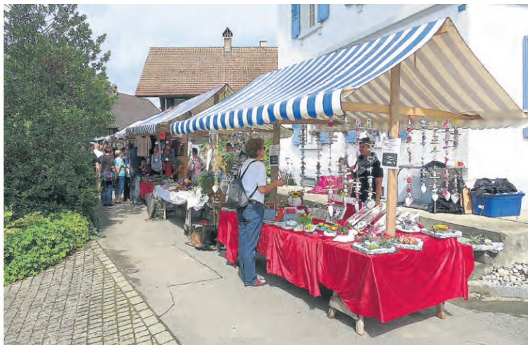
Beim Dörflmärit macht ganz Hettiswil mit

Lokalzeitung und Vereinsorgan mit amtlichen Publikationen für die Gemeinden Bolligen, Ittigen, Ostermundigen, Stettlen und Vechigen Grossauflagen inkl. Worb/Rüfenacht und Krauchthal